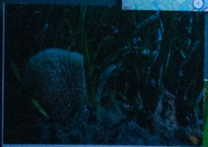
Special mention Young Pinna nobilis - Edoardo Casoli