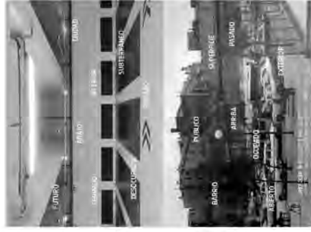
Terrer respecte: operamos desde el Programa.